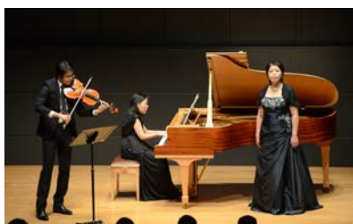
三菱地所賞 音楽部門受賞記念リサイタル 過去開催時の様子

*若手芸術家を支援するため、東京藝術大学を優秀な成績で卒業したアーティストの中から、丸の内より発信する文化・芸術の担い手としてふさわしいと認められる者を選考し授与する賞