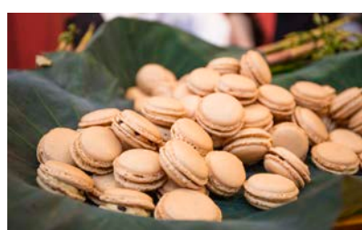
「GEIDAI カフェ」オリジナルメニュー イメージ