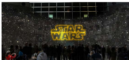
横浜ランドマークタワー 「ドックヤード・プロジェクトンマッピング」 会場パース(イメージ)