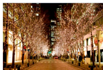
丸の内イルミネーション過去開催の様子

◆ 『NEWエコイルミネーション』とは 従来型LED電球の電力をコントロールすることで、約1/3の使用電力で同等の明るさを得ることに成功した「エコイルミネーション」のエネルギー損失をさらに減少し、高効率化を実現したモデル。