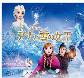
丸ビル1階 マルキューブでは、「アナと雪の女王」の世界観を再現

※限定商品、イベント等の詳細につきましては9月中旬頃プレスリリースを配信予定です。