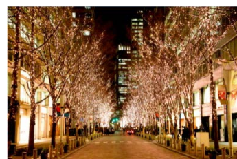
丸の内イルミネーション 過去開催時の様子

本プロモーションの開催に合わせて「丸の内イルミネーション2014」も11月13日(木)よりスタート。有楽町と大手町を結ぶ約1.2kmに及ぶ丸の内仲通り沿いの街路樹約240本が、上品に輝く丸の内オリジナルカラー“シャンパンゴールド”のLED約106万球で光り輝きます。