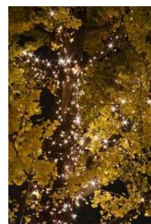
NEWエコイルミネーション (イメージ)

⇒ 輝き、きらめきは従来のエコイルミネーションのまま、消費電力の約30%削減を実現。今年から、約33万球を丸の内ブリックスクエア前～丸ビル前で試験的に導入。