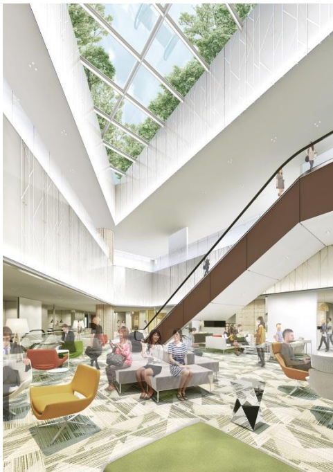
(3階／レストスペース)