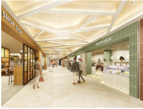
(地下1階／飲食・食物販ゾーン)