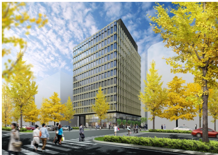
完成予想図（高麗橋三丁目交差点より）