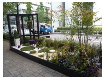
2009年度 コンテスト受賞作品

また、10月22日（金）～24日（日）まで、ご来場の皆様による「オーディエンス賞」の投票を実施。投票いただいた方には、花苗をプレゼントいたします。（各日先着100名様予定。投票場所：丸の内カフェ）