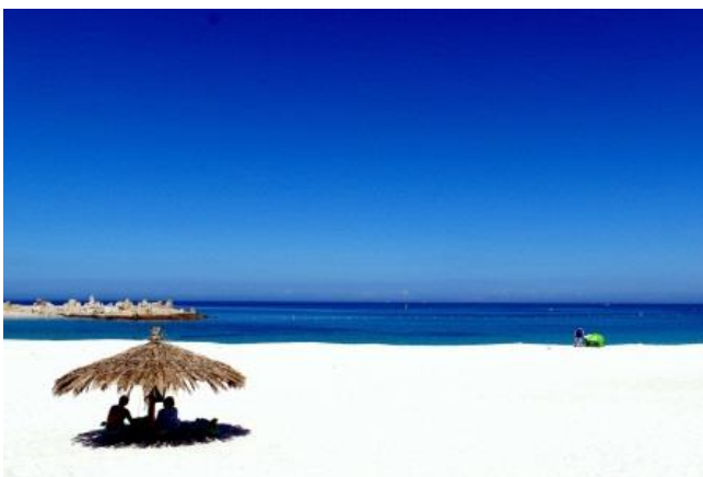
▲和歌山県・白浜町のビーチ

三菱地所は、東京・丸の内を中心に多くのまちづくりを手掛けてきましたが、今後もテナント企業の多様な働き方を支援するとともに、地方創生にも寄与する取組を行ってまいります。