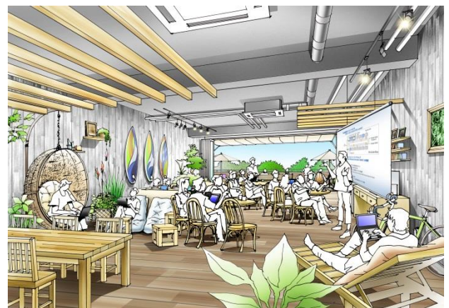
▲(仮称)南紀白浜ワーケーションオフィス イメージ