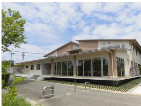
▲「白浜町第 2IT ビジネスオフィス」外観

住所：和歌山県西牟婁郡白浜町 2054 番地の 1 白浜町第 2IT ビジネスオフィス内 面積：約 60 m 2 (約 18 坪) (共用会議室 7 坪、共用スペース 30 坪付帯) アクセス：南紀白浜空港から車で約 3 分、南紀白浜 IC から車で約 10 分