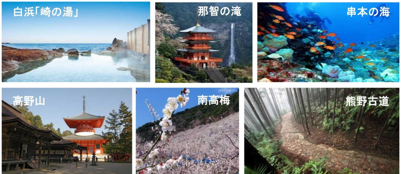
▲和歌山県的主要観光地