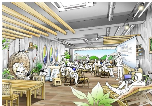
▲「(仮称) 南紀白浜ワーケーションオフィス」イメージ