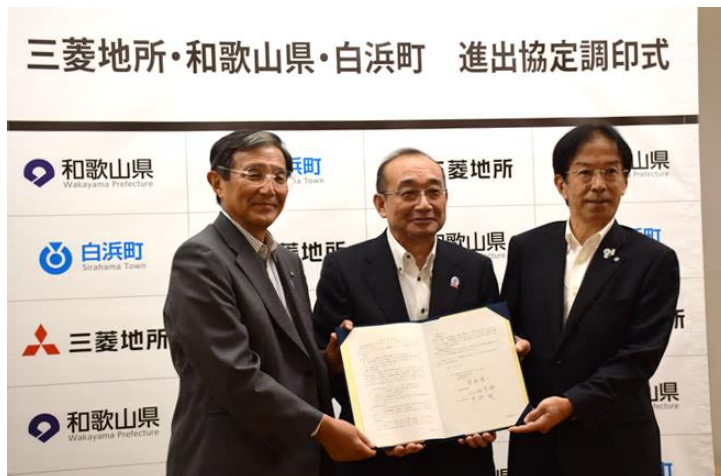
▲（左から）仁坂和歌山県知事、吉田執行役社長、井澗白浜町長