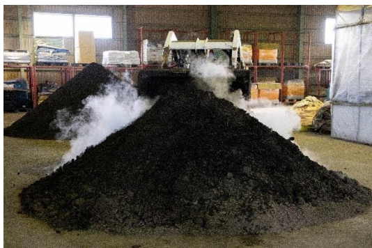
【自社開発の高密度微生物有機培土を使い栽培】