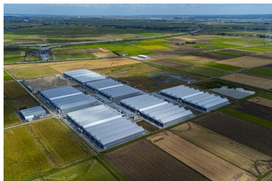
【茨城県稲敷市に新農場開業】