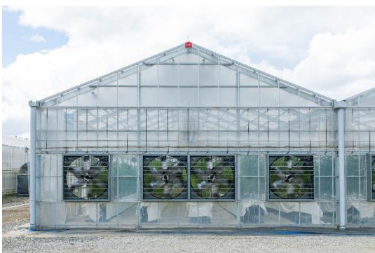
【高機能環境制御ハウスによる通年栽培】