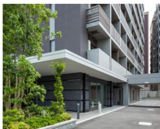
ザ・パークハビオ 巣鴨