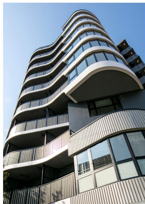
ザ・パークハビオ 神楽坂