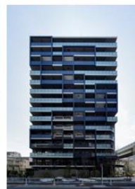
ザ・パークハビオ 木場