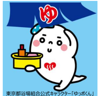
東京都浴場組合公式キャラクター「ゆっpokun」

本イベントは、東京都浴場組合と豊島区浴場組合、バスクリン銭湯部の協力のもと、近年若い人にも注目されている「銭湯」の雰囲気を感じられる会場で、数種類の足湯を楽しめる企画です。さらにサンシャインシティのある豊島区内の銭湯情報なども知ることができ、銭湯グッズなどが当たる抽選会にも参加できる内容になっています。足湯に浸かって温まりながら日本の銭湯文化や豊島区の銭湯情報に触れられる「さんしゃいんの湯」に、是非お越し下さい。