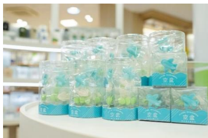
空盆（大）1800円、空盆（小）500円

首都圏における香川県と愛媛県の観光物産発信の拠点である「香川・愛媛せとうち旬彩館」がブースを構え、両県が位置する瀬戸内の旬のものを販売します。また、高松空港直営店の「四国空市場（YOSORA）」も出店し、高松空港限定の商品やことでのことちゃんグッズの販売でイベントを盛り上げます。