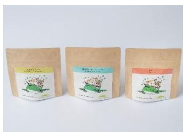
高松空港限定さぬきマルベリーティー （プレーン、玄米、レモン）各400円