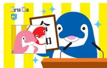
新元号記念 IruCa ステッカー 100円

また、より一層香川の魅力を体験していただくため、せとうちラボラトリーHIYORIさんによる和三盆ワークショップを実施します。参加費は500円ですが、マルシェブースにて2000円以上お買い上げの方は無料で体験いただけます。高松空港限定の空盆も作ることが可能です。