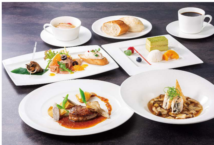
この期間だけのスペシャルメニューをお楽しみください。

【ご予約・お問合せ】 レストラン「テイルウィンド」 03-6830-1101 (6:00～23:00)