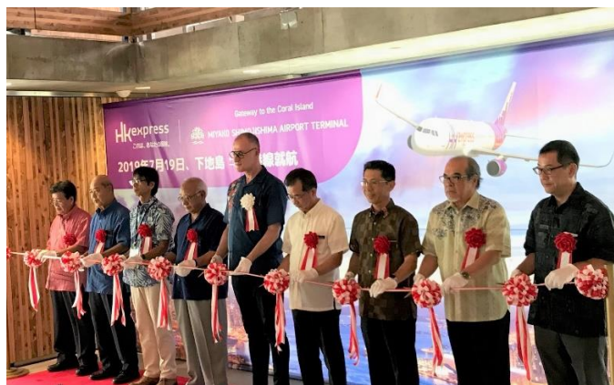
▲就航式典の様子（みやこ下地島空港ターミナル）