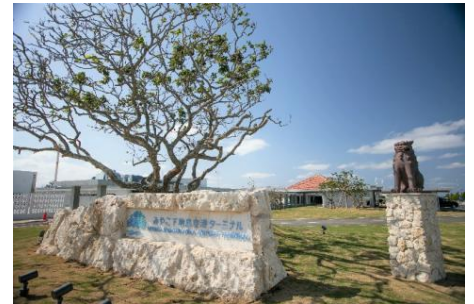
▲みやこ下地島空港ターミナル エントランス