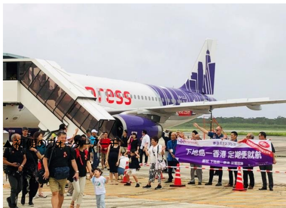
▲駐機場での歓迎の様子

今後も各所との協働のもと路線誘致活動を進め、2021年度までに年間利用客数30万人を目指し、内外の交流人口拡大により地域活性化に貢献してまいります。