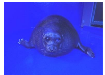
母親のバイカルアザラシ「ラム」

株式会社サンシャインシティ コミュニケーション部 広報担当 成保・中山・大浦 TEL. 03-3989-3329 (平日 9:30～18:00) pr@sunshinecity.co.jp