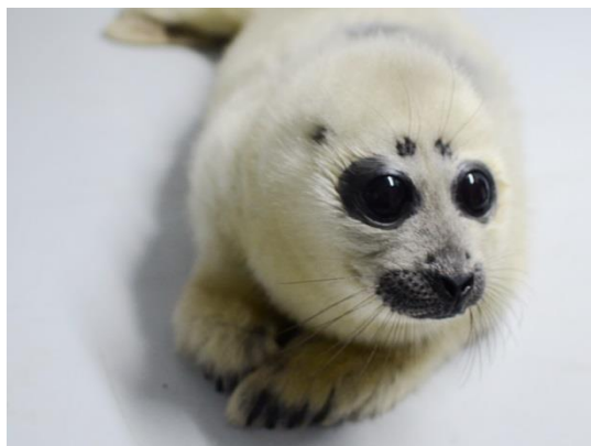
生後16日目（4月12日）の赤ちゃんの様子