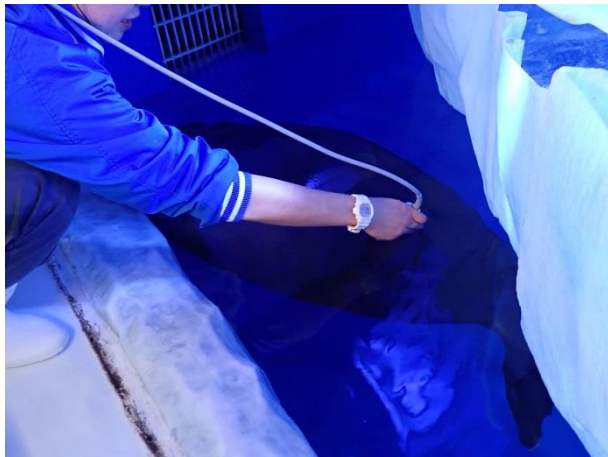
エコー検査の様子

バイカルアザラシの飼育下での繁殖は世界的にもまれで、国内では2006年に新潟市水族館マリニピア日本海で出産した仔の人工哺育例が知られているのみです。バイカルアザラシの寿命は50年ほどと言われ、メスは45歳位まで出産します。自然界の出産シーズンは2月末から4月初旬で、約11か月の妊娠期間を経て、氷上の雪で作られた巣穴の中で1回の出産につき1頭の仔を産むことが知られています。