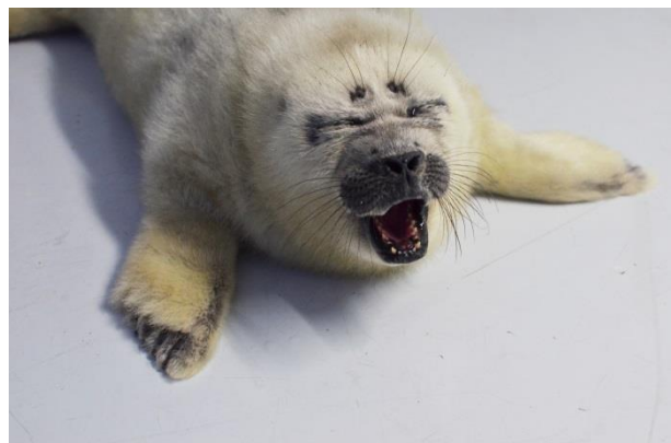
あくびをする赤ちゃん