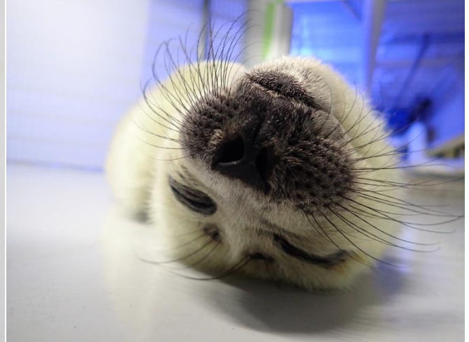
生後10日目（4月6日）の赤ちゃんの様子

サンシャイン水族館(東京・池袋、館長：丸山克志)では 3月27日(水)9時10分頃に、バイカルアザラシの「レオ」と「ラム」に初めて赤ちゃんが誕生 しました。