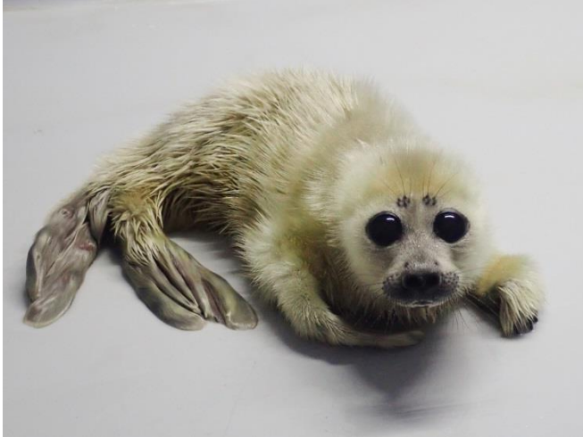
生後2日目（3月29日）の赤ちゃんの様子