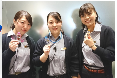
期間中、ミニフィギュアを付けたスタッフがいます。欲しいものがあったら声をかけてみよう！いいことがあるかも。

※コンボ1DAYパスポートとは、レゴランド・ジャパンとシーライフ名古屋両施設が利用できるチケットです。