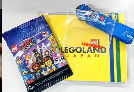
謎を解いてレゴランドのグッズを手に入れよう。わからないときはスタッフに聞いてね。(画像は一例です。内容は変更となる場合がございます。)