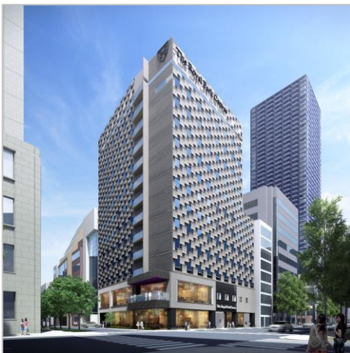
▲外観パース(イメージ)