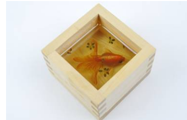
作品名：金魚酒 新夕(にいゆ)2012