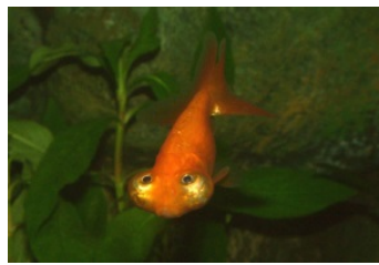
生物名：チョウテンガン