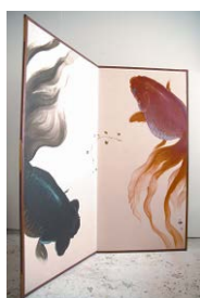
作品名：屏風 金魚の間