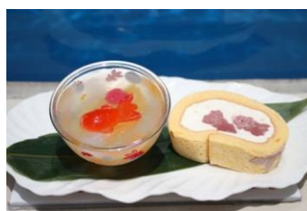
金魚ゼリーとロールケーキ(650円)