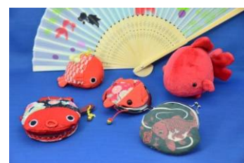
金魚グッズ(イメージ)