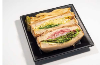
WISE SONS TOKYO