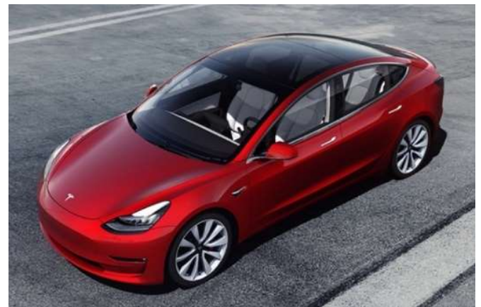
今回導入する電気自動車 「テスラ/モデル3」

近年、カーシェアリングの普及が進んでいますが、太陽光発電を活用した電気自動車を採用することで、環境負荷がより少ないサービスを構築しました。また、ご入居者に手軽に電気自動車を利用いただく機会の創出により、電気自動車普及による環境負荷軽減を図ってまいります。