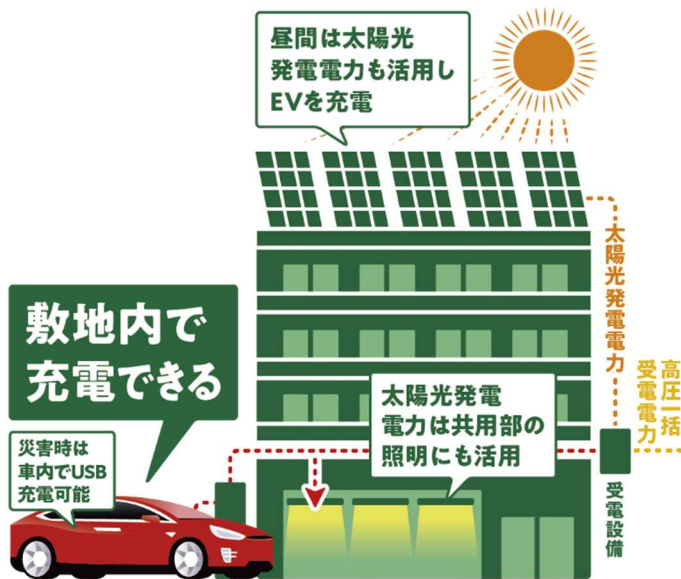
システムイメージ

同サービスの導入により、ご入居者はマンション専用の電気自動車「テスラ」をリーズナブルに使用できます。アプリでの事前会員登録のみで予約から利用、決済までが全てスマートフォンで完結しスムーズに利用いただけます。