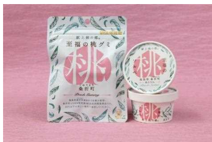
至福の桃グミ、至福の桃ソルベ