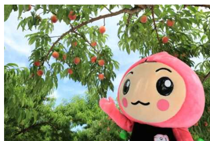
桑折町観光大使「ホタピー」