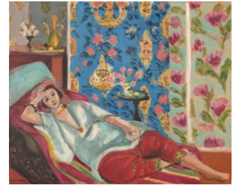
アンリ・マティス《赤いキュロットのオダリスク》 1924-25年頃