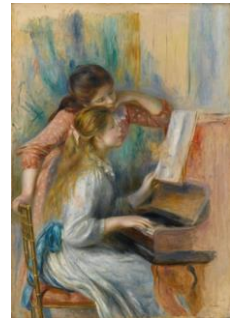
オーギュスト・ルノワール 《ピアノを弾く少女たち》 1892年頃

■ご予約・お問い合わせ：レストラン予約 TEL:045-221-1155(10:00～19:00)