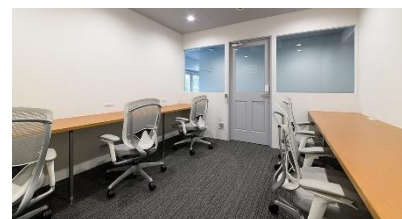
< 「YOXO BOX」オフィス >