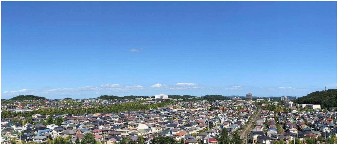
「朝日」から寺岡方面の眺望