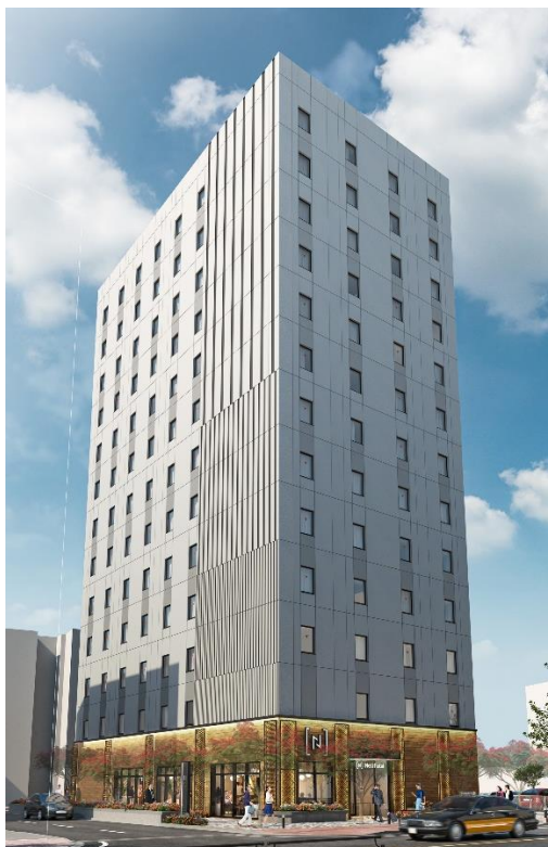
▲完成予想図（建物外観パース）

三菱地所は、多様な宿泊形態に応えるべく、三菱地所グループである株式会社ロイヤルパークホテルズ アンド リゾーツをはじめ、国内外のホテルオペレーターと連携し、ホテルマーケットの動向や立地特性等に応じて幅広いカテゴリーのホテル開発に引き続き取り組んでまいります。