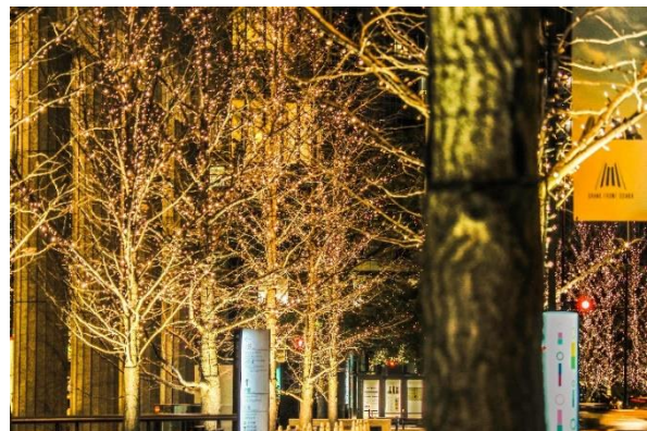
▲過去のシャンパンゴールドイルミネーションの様子