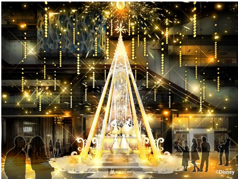
▲ツリー通常時のイメージ

さらに、「アルティメット・プリンセス・セレブレーション」の日本版テーマソング「Starting Now ～新しい私へ」にのせて、ディズニープリンセスたちの“勇気と優しさ”が世界に広がっていくストーリーをイメージしたライティングショーも期間中毎日開催予定です。