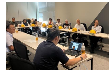
（過年度の現地視察の様子 グラングリーン大阪など）