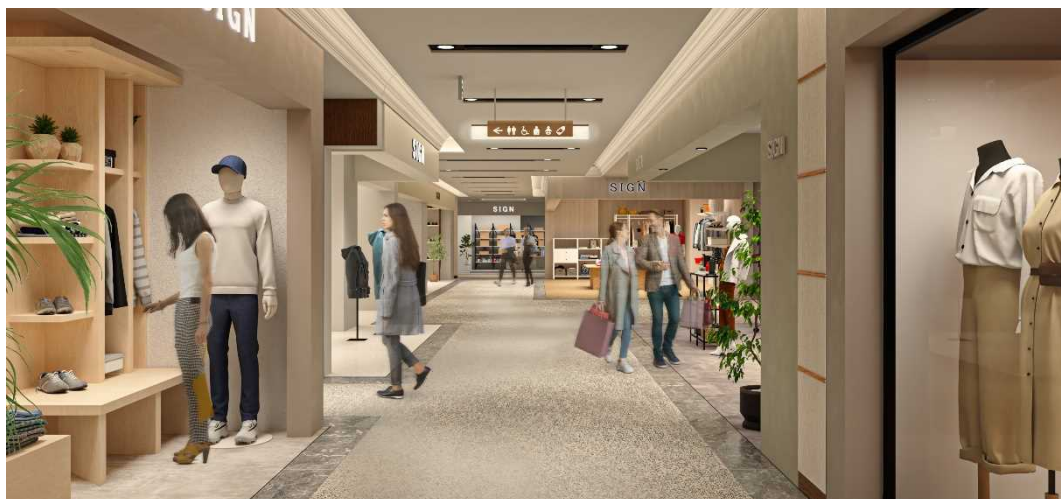
▲リニューアル後 イメージ

また、ファッションゾーンには、丸の内働く大人のニュースタンダードをテーマに、都内最大店舗となるアウトドアブランド『THE NORTH FACE MARUNOUCHI』が出店。都会的なライフスタイルにフィットする最新アイテムを提案します。そして、多様なお客様が集う共用部も改修によって、さらに快適で心地よい空間に生まれ変わります。