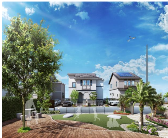
▲ザ・パークハウス ステージ稲毛海岸ヴィラ