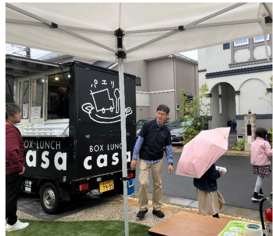
▲当日出店したキッチンカーの様子