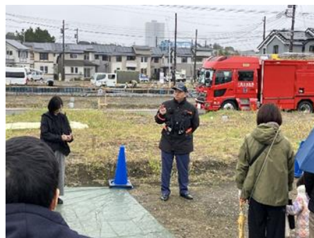
▲消防署からの総評