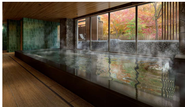
サウナ付き温泉大浴場イメージ