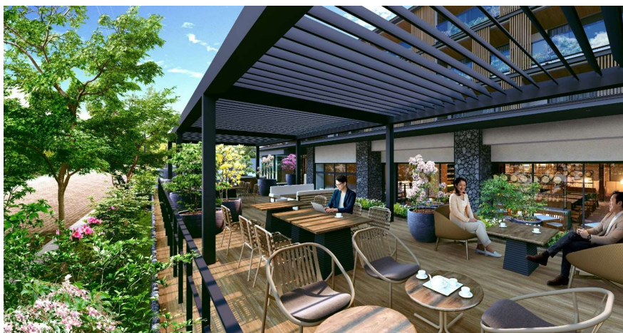
旧軽井沢銀座通り沿いレストランテラスイメージ

本ホテルでは、軽井沢に訪れた人に利用していただけるよう、旧軽井沢銀座通り沿いにレストランテラスを配置しました。本格的なイタリア料理で軽井沢の四季の美味を味わっていただけます。また、旧軽井沢銀座通り沿いの紅葉並木を継承し新たにイロハモミジを植樹することで、食事中も軽井沢の四季折々の変化をお楽しみいただけます。