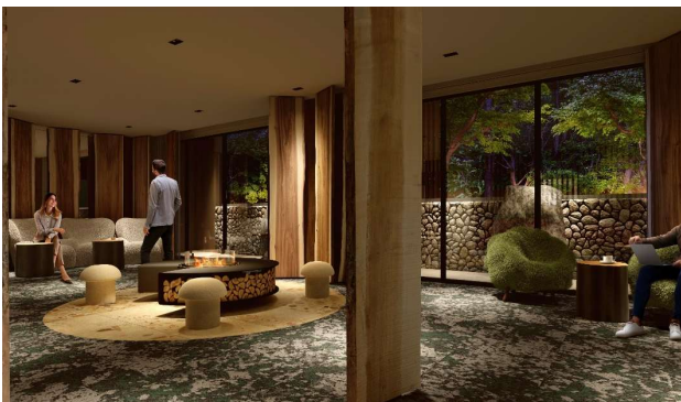
エントランスイメージ

また、サウナ付き温泉大浴場を設け、軽井沢では珍しい温泉を、北軽井沢・応桑温泉からの運び湯を使って楽しめるようにしております。