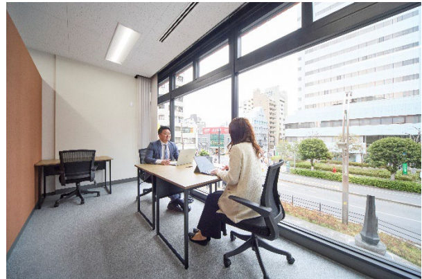
プライベートオフィス