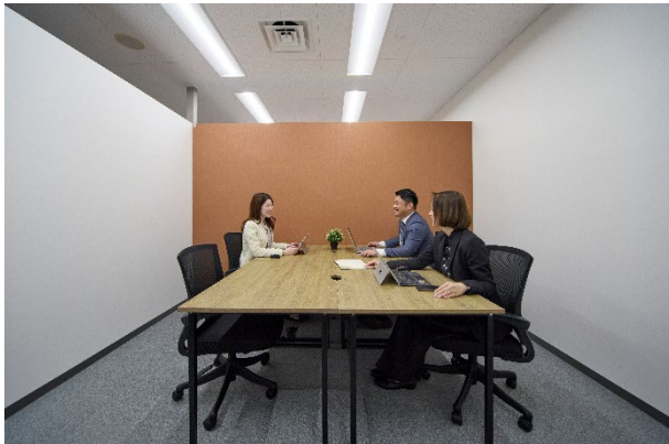
プライベートオフィス