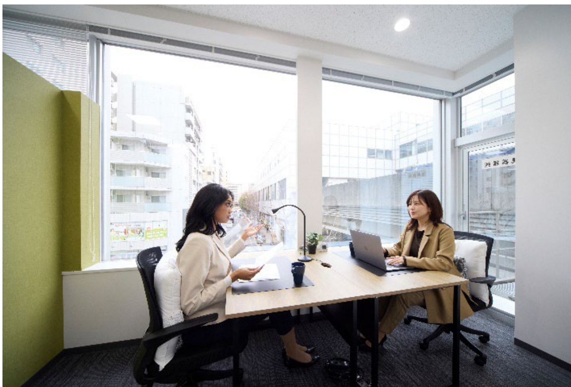
プライベートオフィス