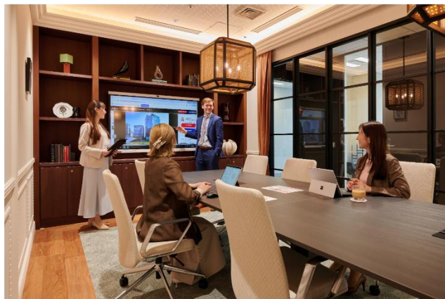
ミーティングルーム