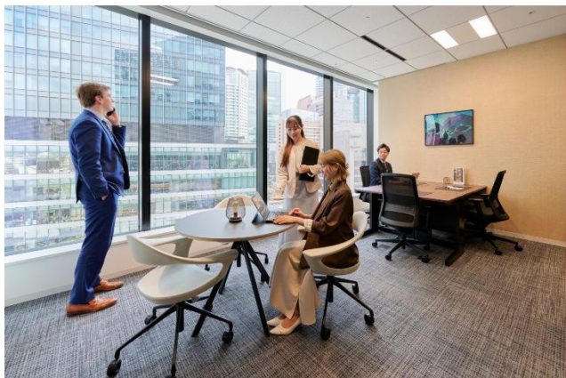
プライベートオフィス