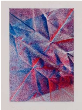
小牟田悠介 《Unfolded #40》2023