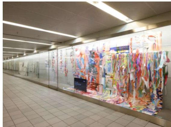
▲会場の展示イメージ