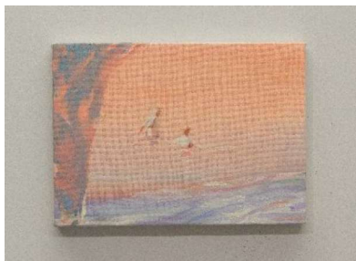
安田悠 《Recall 24-01》2024 © yuyasuda

2012年より東京に活動の拠点を移す。大学時代より田名網敬一に師事。幼少期より多大な影響を受けた漫画カルチャーをもとに、無限に存在する主人公を肯定的に表現。ポップで描き込まれた作風が特徴で、幽霊の様にその場に残り続ける痕跡や物語をエネルギーに満ちた世界観で描く。国内外で作品発表を重ねる傍ら、アートフェアの参加や、私立恵比寿中学、マカロニえんぴつ等のCDジャケットのアートワークなど幅広く活動している。近年の主な個展に、「STRANGE STRANGERS」（OIL by 美術手帖ギャラリー、東京、2025）など。