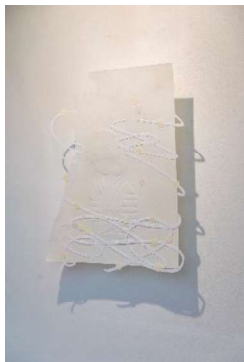
谷澤紗和子《お喋りの効能 -ツボとめぐり-》 2025 © 2025 EUREKA

二次元と三次元を行き来しながら、次元を超えた空間や時間の広がりをも織り込むような作品世界を探索する現代美術作家。近年は、空間や場所との関係性による作品の在り方にも関心を広げ、ベネッセアートサイト直島「家プロジェクト」I邸（2014年、犬島、岡山）でのインスタレーション作品をはじめ、「GENBI SHINKANSEN（現美新幹線）」（2016-20年、上越新幹線臨時列車「とき」12号車内）、陸前高田市でのプロジェクト等に積極的に取り組む。主な展覧会に、2021年個展「新しい天体」（SCAI THE BATHHOUSE、東京）、2020年「SCAI 30 th Anniversary Exhibition：アースライト—SFによる抽象の試み」（駒込倉庫、東京）、2019年個展「space | aspect」（PARCEL、東京）、2016年「Lines of Flight」（Gallery EXIT、香港）、2016年「瀬戸内国際芸術祭2016」（「家プロジェクト」I邸、犬島、岡山）、2015-16年「Breaking through to the actual via the imagination: Long museum collection show concept by Yukohasegawa」（龍美術館、上海）、など。