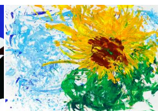
「いつも心に太陽を」 たけぐちりくさん(7 歳)

優秀賞・全応募作品をホームページ ( https://kira-art.jp ) にて公開しています。