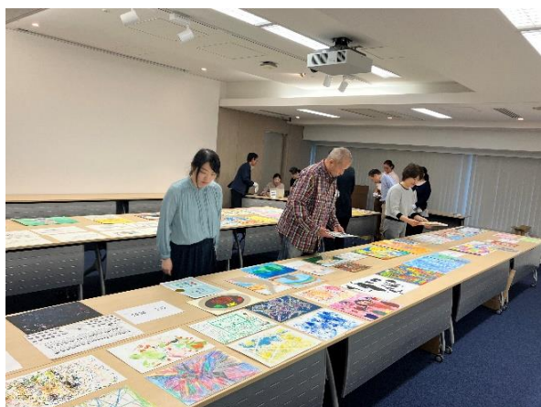
▼一次審査（10 月 15 日）