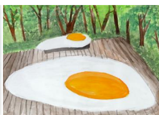
「目玉焼きの森」 おおえりおさん(14 歳)