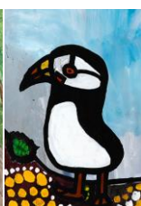
「ツノメドリ」 かわのべだいきさん(18 歳)