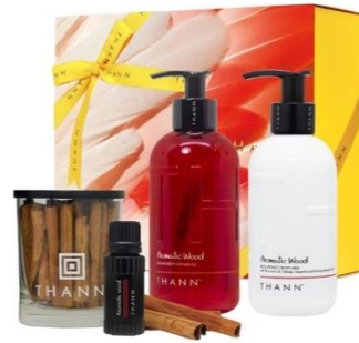
THANN アロマ・ボディケア ギフトボックス ※賞品はイメージです。