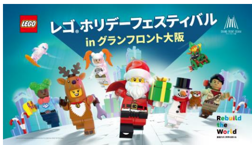
「レゴ®ホリデーフェスティバル in グランフロント大阪」 キービジュアル