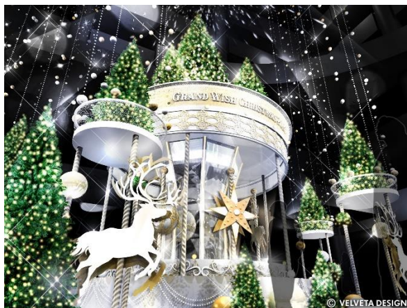
クリスマスツリー空間に入り込んだ体験イメージ