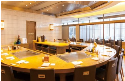
鉄板焼ステーキレストラン 碧

<賞品> A賞：鉄板焼ステーキレストラン 碧 ペアディナーチケット 3組6名様 B賞：THANN アロマ・ボディケア ギフトボックス 15名様