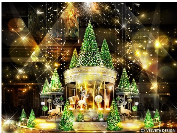
ライティングショー実施イメージ