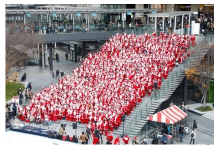
「Grand Santa Bells」 2019年開催の様子