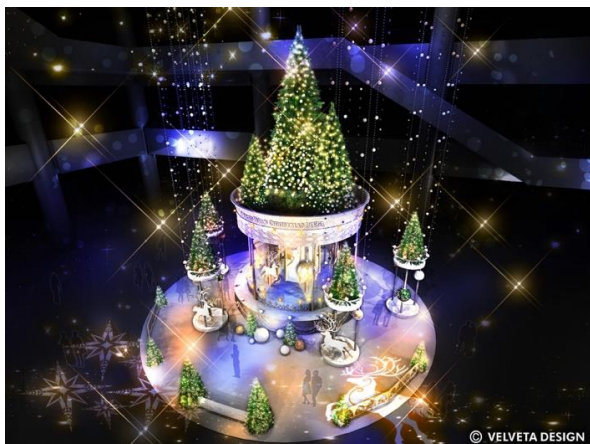
上層階からの眺めのイメージ

クリスマスツリー正面や周辺空間すべてがフォトスポット！360°さまざまな表情を楽しもう！