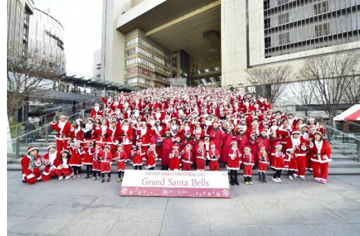
「Grand Santa Bells」過去開催時の様子