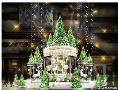
メインクリスマスツリー 「Joyful-Go-Round Tree」イメージ

他にも、Instagramのフォトキャンペーンやショップ&レストランのプレミアム賞品プレゼントキャンペーンなど、期間中に行われるさまざまな展開やイベントを通じて、グランフロント大阪10周年イヤーの締めくくりにあふさわしい感動体験をクリスマスにお届けします。