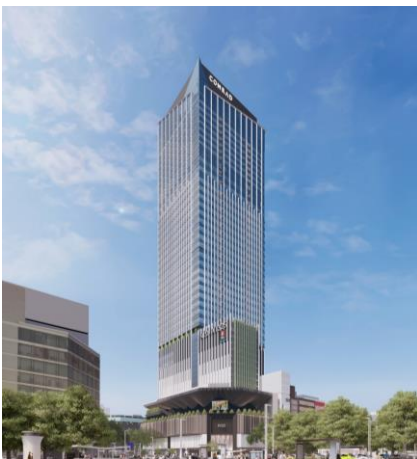
▲外観イメージ (南東側)

本計画は名古屋随一の商業エリア「栄」の中心に位置し、「名古屋の新たなランドマークとなる国内外の文化・交流価値創造拠点」をコンセプトに、栄エリアの都市機能強化を目指し開発を推進しております。栄エリアで最も高い約211mとなる本計画内には、オフィス、名古屋初の「コンラッド・ホテルズ & リゾーツ」や栄エリア初の「TOHO シネマズ」が進出し、商業ゾーンは「J.フロント リテイリンググループ」による商業施設が整備されます。本計画が中日ビル、テレビ塔と共に、名古屋の新たなシンボルエリアとなることで、栄を世界中から人々の訪れる文化交流都心へと躍進させ、名古屋の国際競争力を高めていきたいという想いを込め「ザ・ランドマーク名古屋栄」に決定いたしました。