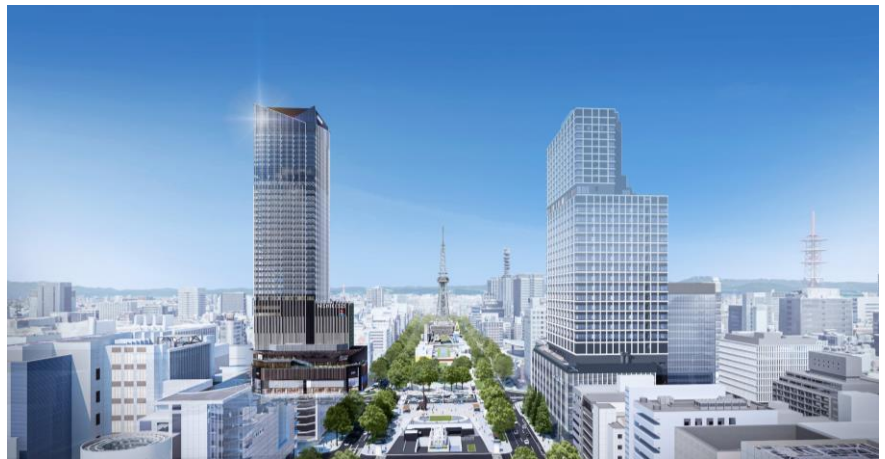
▲久屋大通南側からの外観イメージ (左側が本計画)

本計画を通じ、栄エリアの重層的な都市機能整備を推進することで、栄の求心力を高める新たなランドマークを生み出し、名駅エリアと合わせた2核両輪で名古屋の国際競争力強化に貢献してまいります。