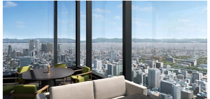
▲40F ホテルルーフトップバーからの眺望イメージ