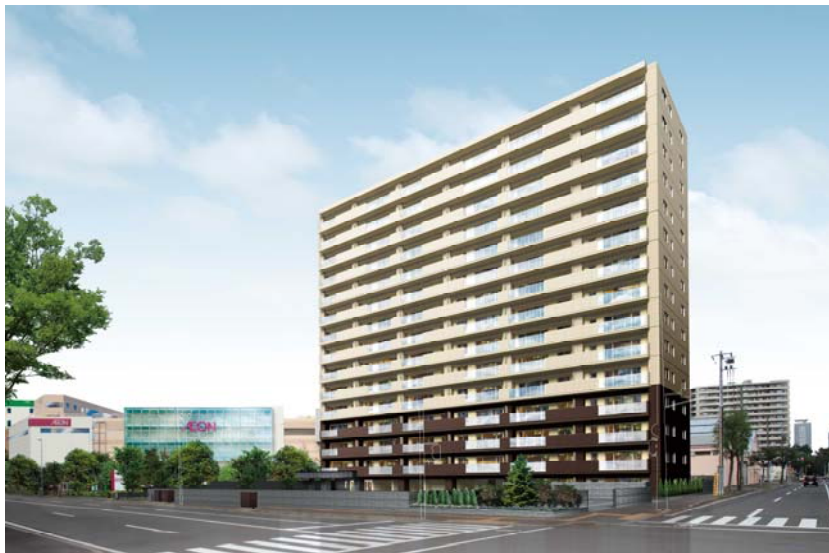
▲「ザ・パークハウス 札幌桑園」外観CG

三菱地所レジデンス(東京都千代田区大手町1-6-1、取締役社長 八木橋孝男)は、マンションブランド「ザ・パークハウス」を冠する物件としては北海道初となる「ザ・パークハウス 札幌桑園」(札幌市中央区・総戸数86戸)の開発に着手しましたのでお知らせいたします。なお、ホームページは11月1日(木)より開設します。