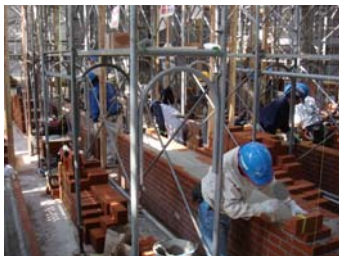
レンガ積みの様子