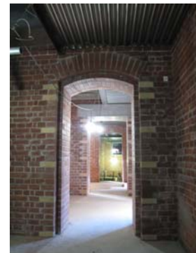
仕上げ前レンガ内壁→