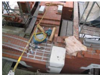
耐震レンガ造の帯鉄