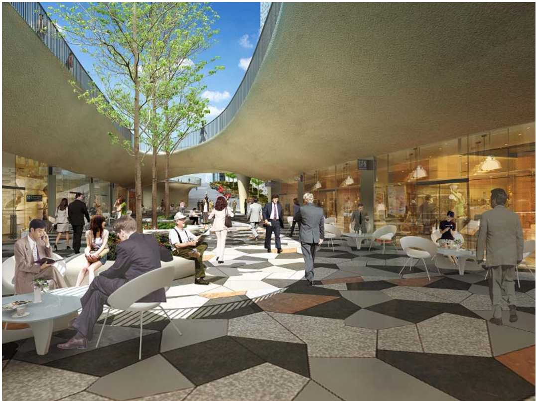
・敷地北側サンクンガーデン店舗ゾーン