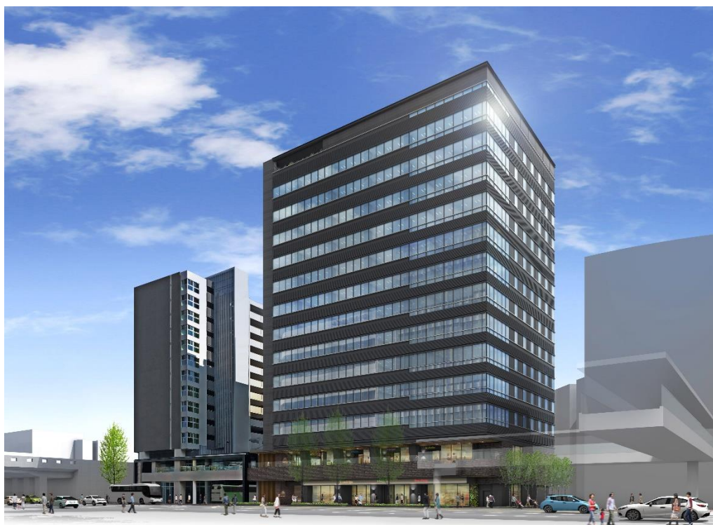
完成予想図（建物外観パース）

本計画は三菱地所と深見興産との共同事業であり、三菱地所の福岡市内における初めてのオフィスビル開発となります。福岡市では、博多駅周辺の活力と賑わいを周辺につなげていく「博多コネクティッド」を推進しており、三菱地所としても当社グループの不動産開発・運営に関するノウハウ・総合力・実績を活かし、更なる発展が期待される福岡市中心部における「街づくり」に貢献すべく、開発事業に積極的に取り組んで参ります。