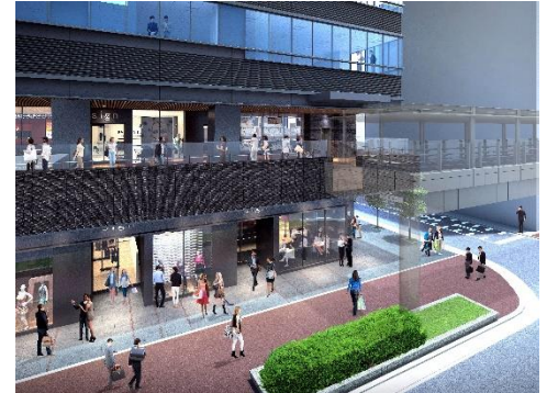
2F 歩行者デッキ接続フロア