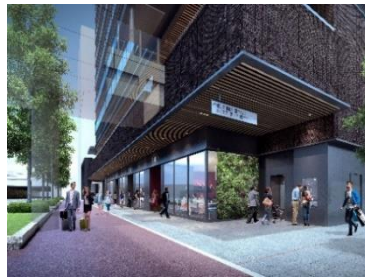
賑わいを創出する商業ゾーン