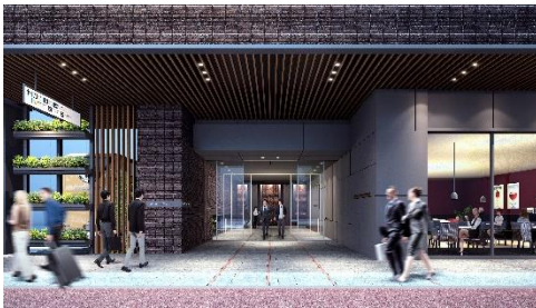
開放的なオフィスエントランス