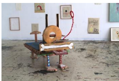
『LOVE』 西川 真雪 (名古屋造形大学 造形学部造形学科洋画)