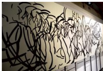
『打つ』 水戸部 春菜 (東北芸術工科大学 デザイン工学部グラフィックデザイン学科)

※作品写真は一部展示作品と異なります。また、2018年3月卒業・修了時点の大学名を明記しております。