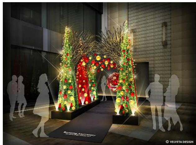
「Marunouchi Bright Christmas 2017」 左：丸ビル「Blooming Anniversary Tree」イメージ(ライティングショー実施時) 右：新丸ビル「Blooming Arch」イメージ