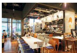
MUS MUS (無国籍料理)