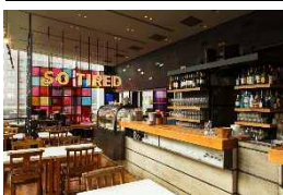
SO TIRED (ダイニング)