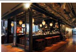
欧風小皿料理 沢村 (熟成酵母パンと欧風小皿料理)