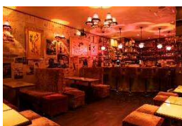
来夢来人 (喫茶・バー)