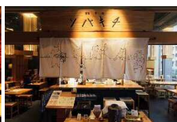
ソパキチ (蕎麦・酒・肴)