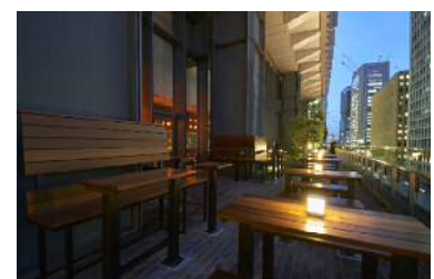
「丸の内ハウス テラス」