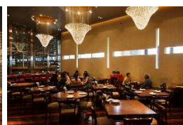
RIGOLETTO WINE AND BAR (スパニッシュイタリアン)