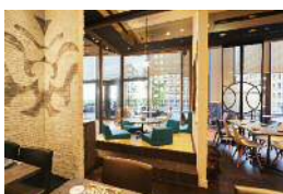
東京和食 文史郎 (和食酒場)