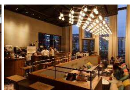
HENRY GOOD SEVEN (ラウンジ ダイニング)