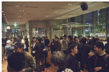
「PEACEFUL JOURNEY TOKYO MARUNOUCHI FASHION NIGHT」過去開催時の様子