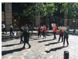
「バグパイプ行進パフォーマンス」過去開催時の様子