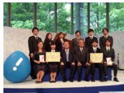
「三菱地所賞」授与式