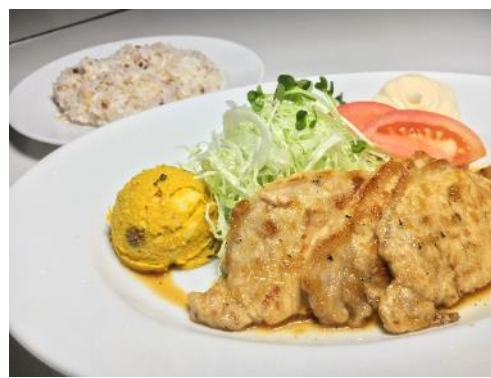
GEIDAIカフェ by キャッスル食堂 メニューイメージ