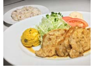
GEIDAIカフェ by キャッスル食堂 メニューイメージ