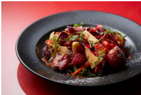
「ルージュプレート」 ¥1,800(税込)

【内 容】“街のゲストハウス”をテーマに個性的な9つの飲食店舗からなる丸の内ハウスを会場に、藝大との初コラボレーション企画。作品展示のほか、各店舗内でのテーマカラーの「赤」をイメージした期間限定のメニューを提供します。