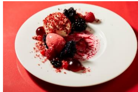
「フランボワーズのムースとバラのジェラート」

いちご、牛モモ肉、万願寺、アンデープ、ラズベリー、赤水菜、フルーツマト、いちぢくなど、時季と赤色の食材を少しずつ楽しめるプレートです。