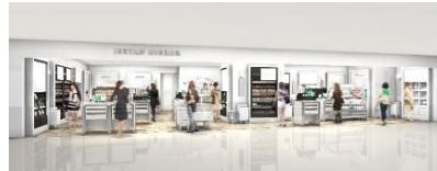
※イセタン ミラー メイク&コスメティクス 店舗イメージ

アディクション/イヴ・サンローラン・ポーター/イブサ/クリニーク/コパコ/コンフォートゾーン/SHISEIDO/シュウ ウエムラ/ナーズ/ポーラ/メイクアップフォーエバー/ランコム/ルナソル/ローラ メルシエ など