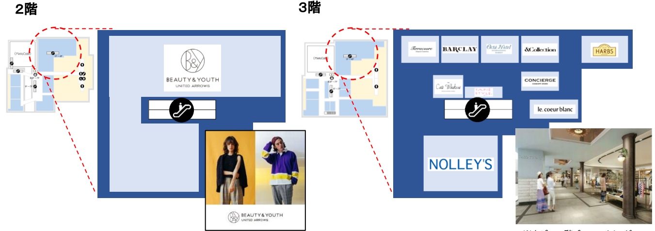
※丸ビル3階ゾーン イメージ