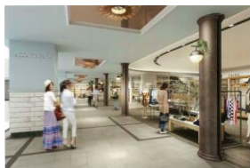
※丸ビル3階ゾーン イメージ

丸ビル及び新丸ビルは、2018年春まで新規&リニューアルオープン店舗が続々登場。就業者をはじめ、お客様にとっての利便性向上をはかり、さらなる深化を続けてまいります。