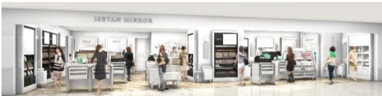
※新丸ビル新規オープン「イセタン ミラー メイク&コスメティクス」店舗イメージ