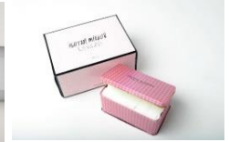
※オリジナルコットンボックス