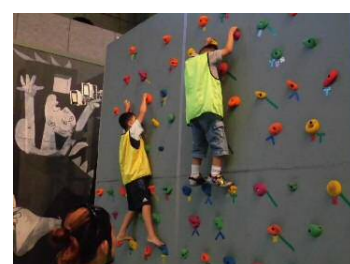
ボルダリングイメージ