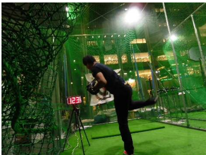
過去開催時の様子(野球・球速計測)

丸の内では、スポーツを通じた交流により、年齢・国籍を問わず様々な人々との相互理解や認識を一層深めていく機会を創出します。昨年より設けられた山の日からはじまる連休を中心に、イベント満載の丸の内にぜひお越しください。