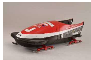
展示イメージ (協力:下町ボブスレー)