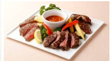
「丸の内POWERFOOD」メニュー一例