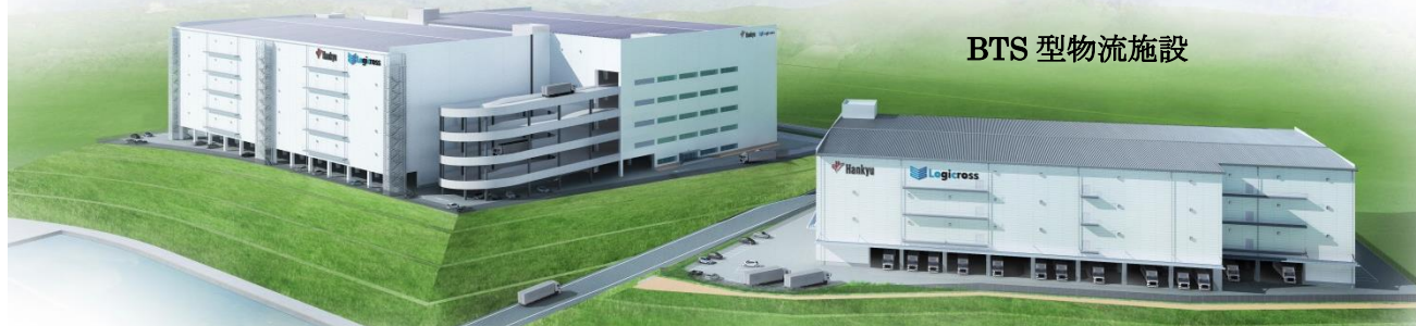
完成時の外観イメージ