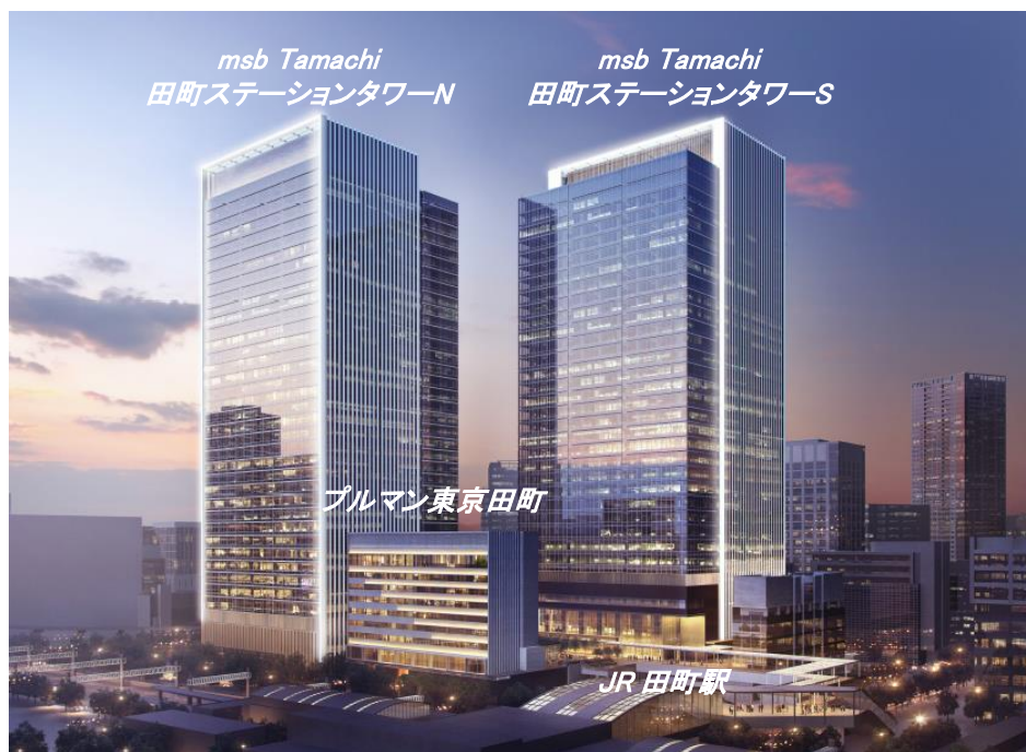
外観イメージパース