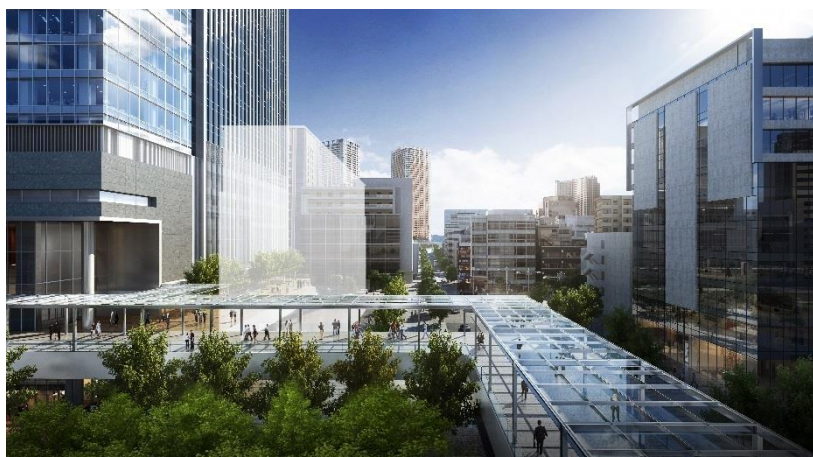
JR 田町駅からのデッキイメージパース