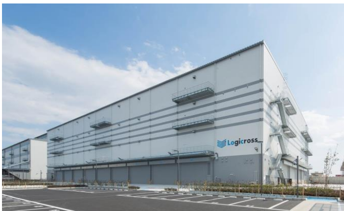
ロジクロス厚木 外観

三菱地所は、お客様の物流オペレーション効率化・ビジネス拡大をサポートすべく、総合不動産デベロッパーとして今まで培ってきたノウハウ・ネットワークを活かしながら、今後も年間2~4件の開発用地取得を目指すとともに、積極的に高機能な物流施設の開発に取り組み、国内物流網の更なる発展・効率性の向上をかなえ、優良な社会インフラの向上に貢献してまいります。