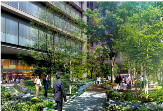
ホトリア広場（イメージ）