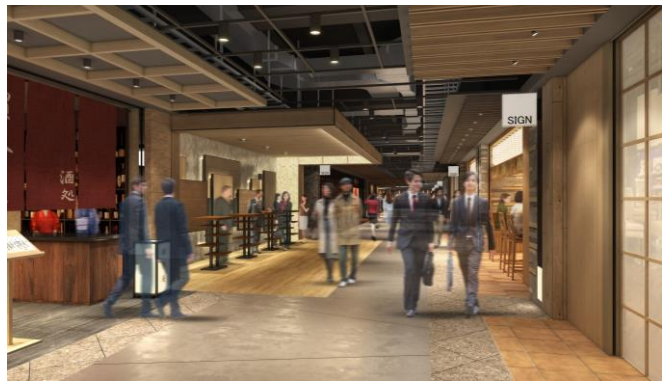
地下1階商業ゾーン（イメージ）