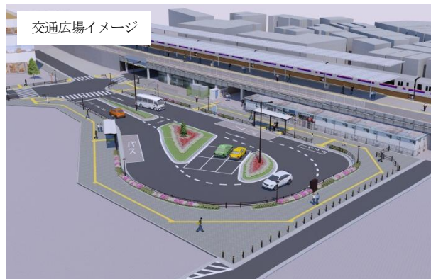
※上記パースは変更となる場合がございます。

共同住宅を中心に、生活利便施設や医療福祉系施設など様々な都市機能が集い、多彩な活気や人々の交流を生み出す街として順次開発が進行中。昨年6月末には日光街道から繋がる足立区画街路11号線（かつら並木通り）が一部開通し、本年3月には同道路の全面開通と共に千住大橋駅前の交通広場が供用開始となる等、着々と交通網も整備されています。